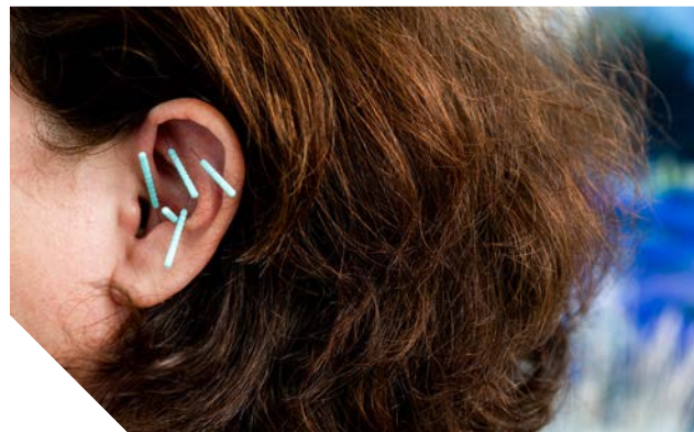
Entspannende Ohrakupunktur nach NADA